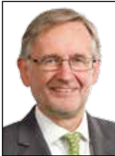
Johannes W. Wolters Quintessenz Verlag